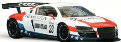
Audi R8 GT3