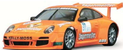
Porsche 997 GT3