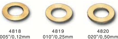
Pick-up guide spacer brass