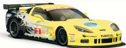
Corvette C6R GT2